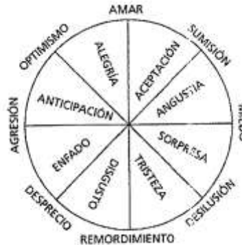
Círculo emocional de Robert Plutchik

En cuanto al número de emociones básicas existentes Plutchik elabora gráficamente un círculo emocional donde relaciona todas las emociones, considerando la existencia de 8 emociones básicas que pueden variar en tres niveles de intensidad .